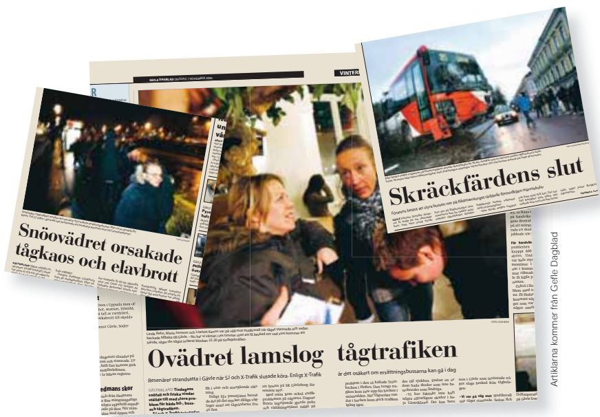
Artiklarna kommer från Gävle Dagblad